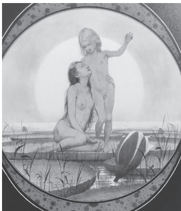
Bild 4. Fidus: Vom Himmel.

Die Annahme, das Kind sei heil und rein von Anfang an kann dazu verleiten, das pädagogische Verhältnis nicht mehr als solches zu erkennen. Vielmehr kann es in eine völlig freilassende Beliebigkeit, oder gar in eine Umkehrung der Beziehungen entgleisen. Dann wird das Kind zum Messias stilisiert, zum Erlöser, vor dem Erwachsene sich zu verneigen und die Krone abzulegen haben, wie Montessori oder Key fordern. Die schwarz-weiß Malerei von Fidus mit dem Titel: „Vom Himmel“ illustriert diese Umkehrung. Das Kind ist ein Junge. Und wie bei allen diesen Bildern sind Mädchen und Frauen immer in der dienenden, verehrenden, hütenden Position, Buben dagegen in der führenden, erhabenen, herrscherlichen. Das Kind kommt aus dem Licht und weist zum Licht. Es kennt den Weg unzweifelhaft. Dieses Kind kann nicht frech, wild, „unbotmäßig“ oder widerständig sein. Gerade die Idealisierung blendet aus, was vom Kind an eigenwilliger, individueller