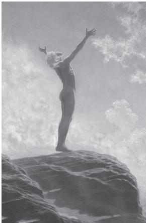
Bild 3. Fidus: Lichtgebet.

Im Museum auf dem Monte Verità in der Casa Anatta findet sich das bekannte Bild „Lichtgebet“ von Hugo Höppner (1886–1946), alias Fidus. Er war geprägt von theosophischer Lichtsymbolik und als Jünger von Diefenbach und Gusto Gräser von deren Faszination für Feuer und Sonne. „Die größte Sehnsucht der seltsamen Gemeinde, die da oben auf dem Berge hauste, ging nach Sonne“ (Landmann, 2000, S. 51). Frei, wie die Natur ihn geschaffen, so streckt sich der schlanke Jüngling dem Licht entgegen. „Auf zu neuen Ufern, zur Freiheit – das ist die Botschaft. Dieser vielleicht einflussreichste Künstler der (deutschen) Jugend- und Lebensreformbewegung zeigt in einer Vignette auch den einzuschlagenden Weg des Werdens“ (Skiera, 2006, S. 31). Der Weg ist klar und liegt offen, man muss nur noch abheben und sich der freien Dynamik überlassen, ohne Fragen oder Zweifel. Ein Hauptwerk Diefenbachs, der scherenschnittartige Fries ‚Per astra ad astra‘, zeigt spielende, ideale Kinder. Fidus