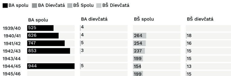
Graf 2. Počty žiakov na priemyselných školách v Bratislave a Banskej Štiavnici v rokoch 1939–1945. 26

dievčatá „prístup už len na staveľské oddelenie“. 24 V školských rokoch 1939/40–1944/45 tu študovalo 0,35 % – 0,76 % dievčat. V tom období na škole vyučovali iba muži, ženy v profesorskom zbore nefigurovali. 25 Presné údaje o počtoch študentiek sa nachádzajú v grafe 2.