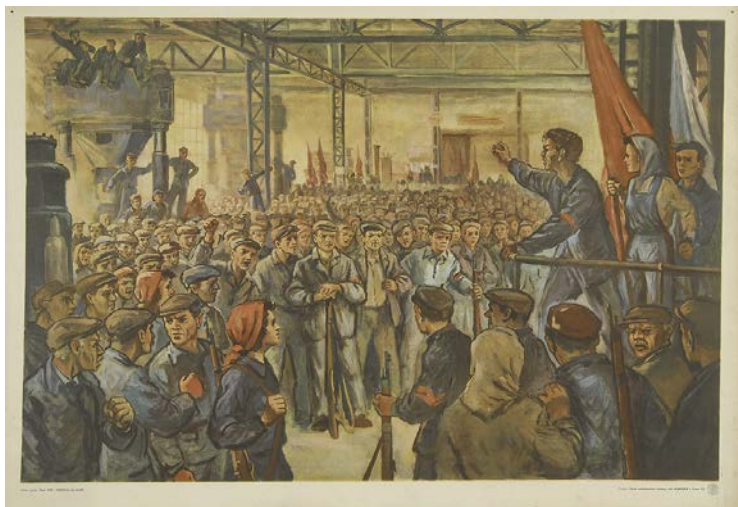
JUNEK, Václav: školní obraz Únor 1948 - (Dělnictvo na stráž) ; Státní nakladatelství učebnic, závod Komenium v Praze, vydáno v 1. pol. 20. století.