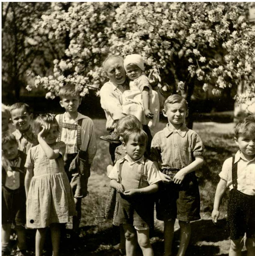
Humanista Přemysl Pitter na zahradě lékařského domu v Ládvi se zachráněnými židovskými dětmi z koncentračních táborů. Květen 1945.