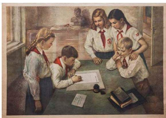
DVOŘÁKOVÁ Růžena: školní obraz: Pionýři píší dopis prezidentu Klementu Gottwaldovi ; Státní pedagogické nakladatelství Praha, vydáno v roce 1952.