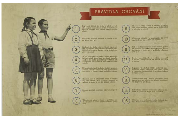
Anonym: školní obraz: Pravidla chování ; Státní pedagogické nakladatelství Praha, vydáno v roce 1952.