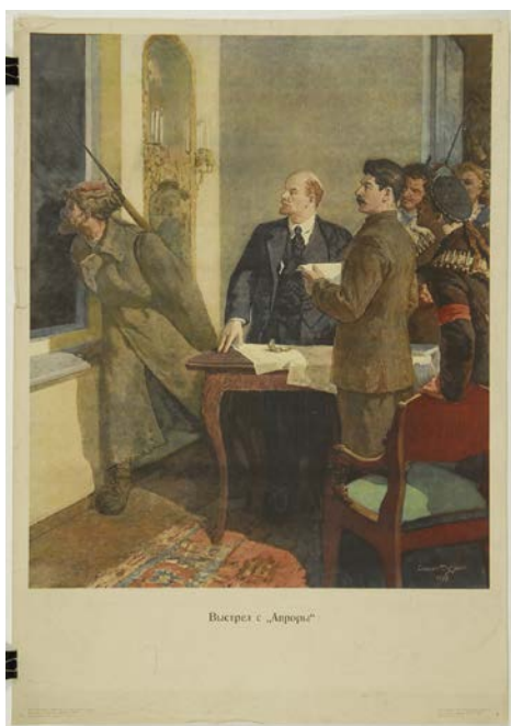
DUDNIK, Stěpan: školní obraz: Výstřel z Aurory ; Státní pedagogické nakladatelství, Moskva, vydáno v roce 1949.